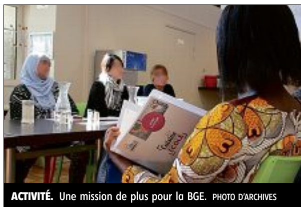
ACTIVITÉ. Une mission de plus pour la BGE.

Orléans Technopole pilotera un programme d'accélération appelé « émergence » pour quinze porteurs de projet. Autour d'Orléans dans un premier temps puis, pour les prochaines promotions, du